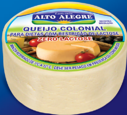
Queijo Colonial ZERO LACTOSE 700g Cód. de Barras: 7898955711248 Fd. com 25 Unid.