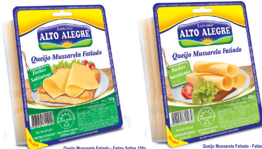
Queijo Mussarela Fatiado - Fatias Soltinhas 150g Cód. de Barras: 7898955711002 Cx. com 42 Unidades