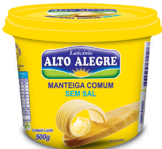
Manteiga Comum Sem Sal 500g Cód. de Barras: 7898955711347 Cx. com 12 Unidades