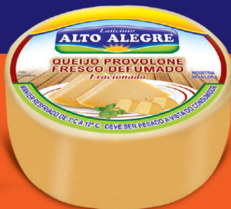
Queijo Provolone Fresco Defumado Peça 600g Cód. de Barras: 7898955711071 Fd. com 25 Unid. - Cx. com 18 Unid.