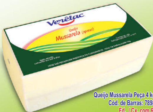
Queijo Mussarela Peça 4 kg - Verêlac Aparas Cód. de Barras: 7898955711224 Fd. / Cx. com 6 Peças