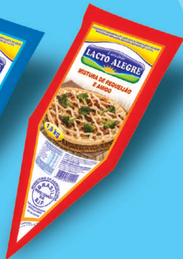
Mistura de Requeijão e Amido 1,8 kg Cód. de Barras: 7898955711255 Cx. com 8 Unidades