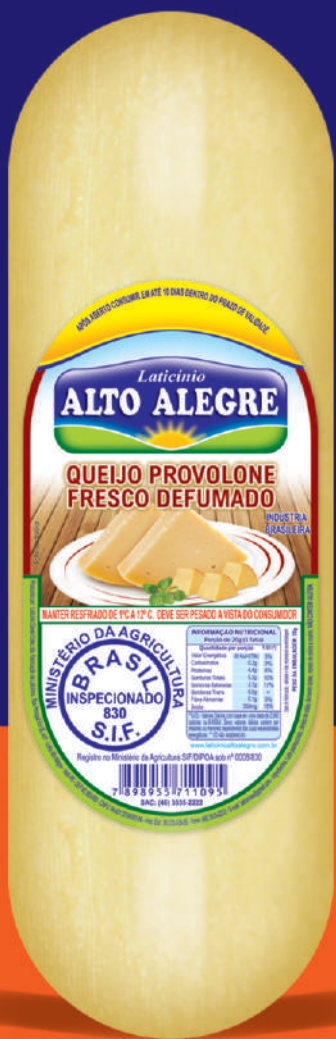
Queijo Provolone Fresco Defumado Peça 5 kg Cód. de Barras: 7898955711095 Fd. com 5 Peças / Cx. com 4 Peças