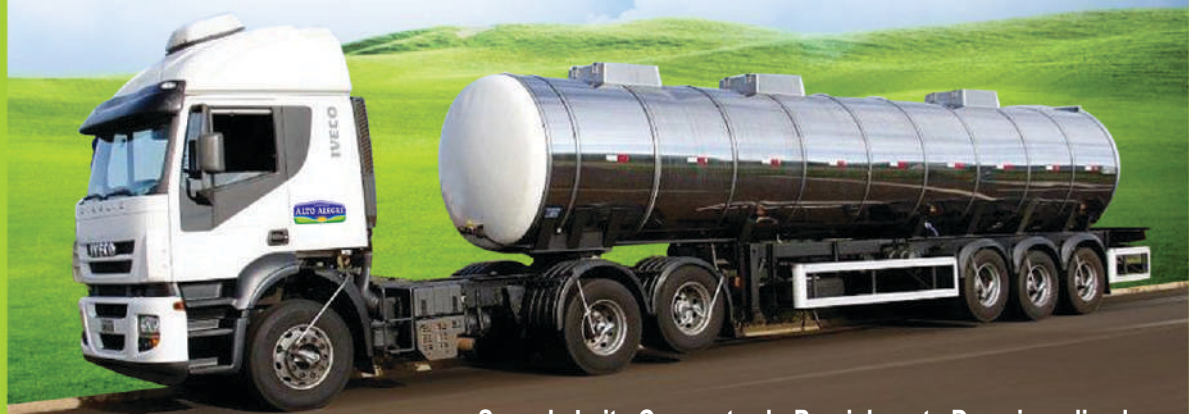
Soro de Leite Concentrado Parcialmente Desmineralizado Leite Fluido a Granel de Uso Industrial Soro de Leite Refrigerado