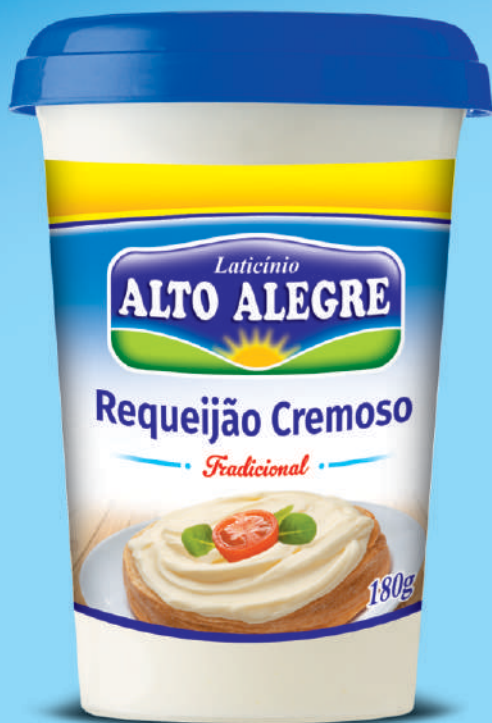
Requeijão Cremoso 180g Cód. de Barras: 7898955711422 Cx. com 24 Unidades