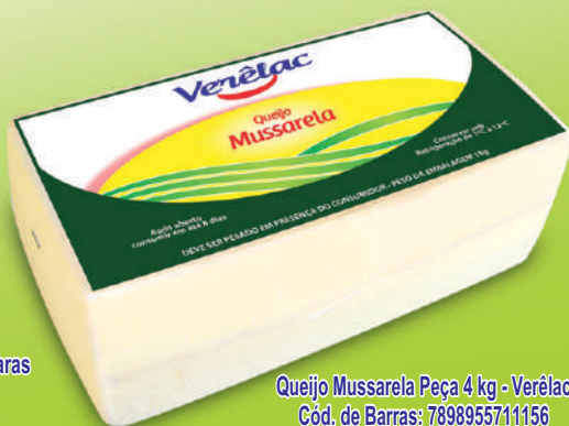
Queijo Mussarela Peça 4 kg - Verêlac Cód. de Barras: 7898955711156 Fd. / Cx. com 6 Peças