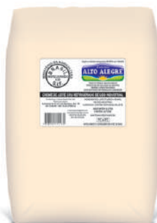
Creme de Soro de Leite Cru Refrigerado de Uso Industrial 20 kg Cód. de Barras: 7898955711187 Fd. com 1 Unidade