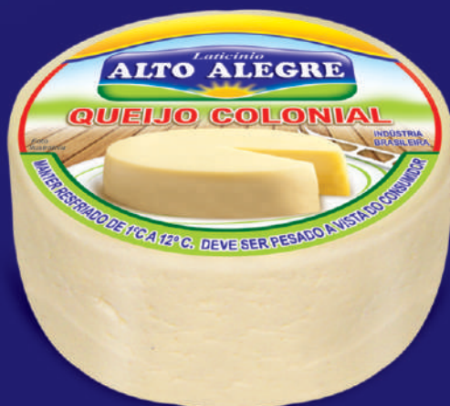
Queijo Colonial Peça 700g Cód. de Barras: 7898955711101 Fd. com 25 Unid. / Cx. com 18 Unid.