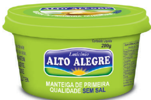
Manteiga de Primeira Qualidade Sem Sal 200g Cód. de Barras: 7898955711330 Cx. com 12 Unidades