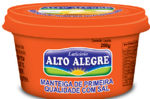
Manteiga de Primeira Qualidade Com Sal 200g Cód. de Barras: 7898955711286 Cx. com 12 Unidades