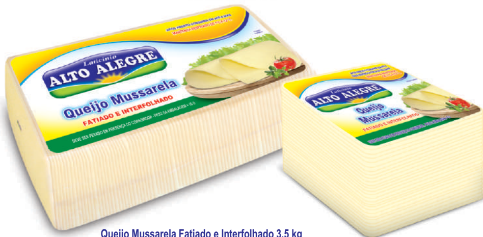
Queijo Mussarela Fatiado e Interfolhado 3,5 kg Cód. de Barras: 7898955711040 Fd. com 6 Unidades