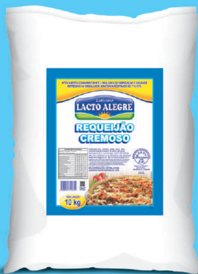
Requeijão Cremoso 10 kg Cód. de Barras: 7898955711354 Cx. com 1 Peça