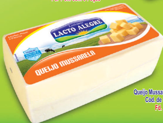
Queijo Mussarela Peça 4 kg - Lacto Alegre Cód. de Barras: 7898955711484 Fd. / Cx. com 6 Peças