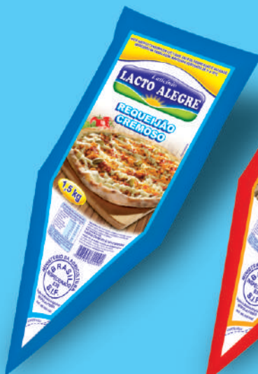
Requeijão Cremoso 1,5 kg Cód. de Barras: 7898955711262 Cx. com 12 Unidades