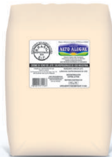
Creme de Leite Cru Refrigerado de Uso Industrial 20 kg Cód. de Barras: 7898955711170 Fd. com 1 Unidade